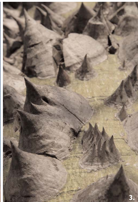
1. UN RIZO NATURAL EN LA HOJA DE UN PEHUAJO. 2. LORO HABLADOR, UNA ESPECIE EN RETROCESO NUMÉRICO POR SU CAPTURA ILEGAL COMO MASCOTA DE COMPAÑÍA. 3. TRONCO DEL PALO BORRACHO DE FLOR ROSADA O SAMOHU. 4. TATU BOLA , EL ÚNICO ARMADILLO CAPAZ DE CERRARSE TOTALMENTE SOBRE SI MISMO, CONVIRTIÉNDOSE EN UNA FORTALEZA INEXPUGNABLE PARA SUS PREDADORES.

De esta manera el Chaco Húmedo se caracteriza por la presencia de densos bosques o selvas en galería que acompañan a los ríos, palmares con pastizales en las zonas altas, y una variadísima vegetación que puebla los ambientes acuáticos.